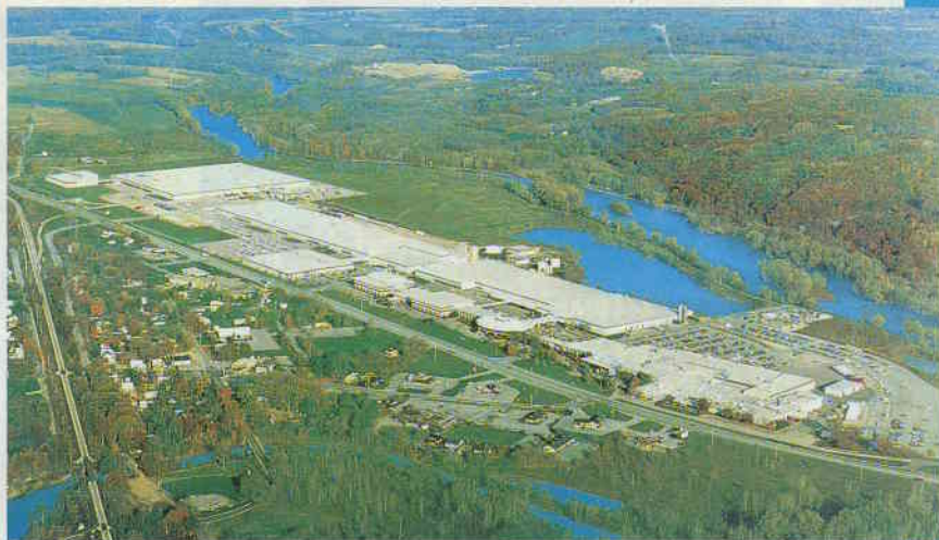
Amway Corporation Ada-Michigan

Auf dem richtigen Weg – der Umwelt zuliebe