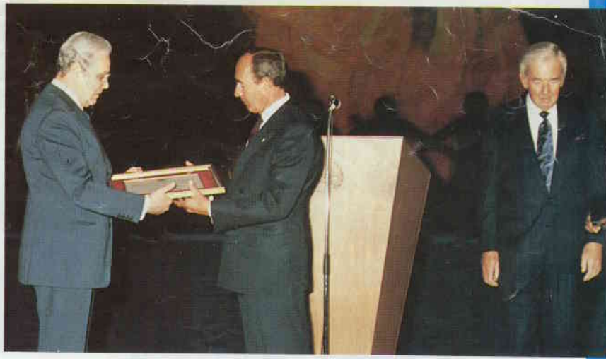
UNO-Generalsekretär Perez de Cuellar überreicht den Umweltpreis an die Firmengründer Rich DeVos und Jay Van Andel

Ausgezeichnet mit dem Umweltpreis der Vereinten Nationen 1989